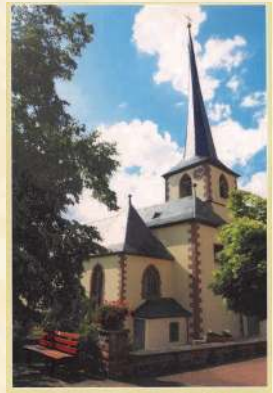
Beiträge zur Ortsgeschichte / Nr. 1 Kleiner Führer durch die Pfarrkirche Mariä Himmelfahrt Steinfeld